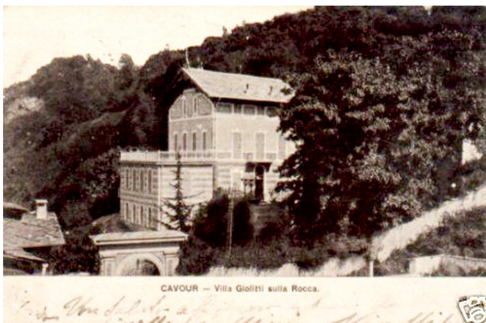
CAVOUR - Villa Giolitti sulla Rocca.

Una breve ma sentita cerimonia con la deposizione di una Corona d'Alloro seguita da un minuto di silenzio e di raccoglimento in preghiera per colui che ancor oggi rappresenta un punto di riferimento e di eredità politica per quanti hanno a cuore i destini dell'Italia.