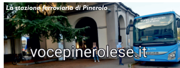
La stazione ferroviaria di Pinerolo

Questa volta la vittima è un ragazzo di 19 anni che era in attesa di prendere un bus per Frossasco, per tornare a casa. Ad aggravare quanto avvenuto è stata l'indifferenza dei presenti. La mamma di questo ragazzo ha scritto una lettera denuncia al nostro giornale che noi pubblichiamo integralmente. Resta il fatto che, nonostante il grande impegno dei carabinieri di Pinerolo, la situazione nella stazione, giardini di piazza Garibaldi, continua a essere ad alto rischio minicriminalità. Lo spaccio continua come le azioni criminali. Questo giornale continuerà a denunciare ogni azione. Al lettore ogni commento.