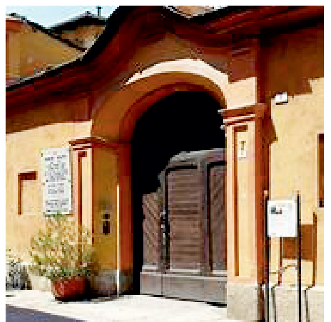
Casa Giolitti Plochiù