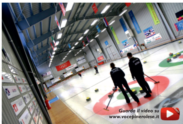
Guarda il video su www.vocepinerolese.it

Qui: https://www.vocepinerolese.it/articoli/2023-09-28/non-risposte-della-maggioranza-salvai