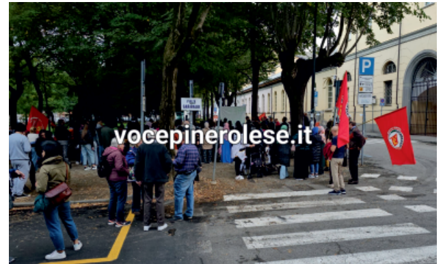
Si sono vantati di aver ucciso degli ebrei".

quando bestie umane hanno trucidato, violentato, ucciso, portato via, come scudi umani, bambini, uomini, donne anziani. Lo scontro tra palestinesi e israeliani, ormai in corso da decenni, dal 1948, dalla nascita dello stato d'Israele, è, in realtà, una guerra di religione mai dichiarata e, riportando sempre le parole di Lia Levi: "I terroristi di Hamas non hanno detto: abbiamo ucciso tot israeliani.