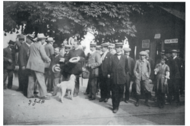
15 luglio 1912 S.E. G. Giolitti in partenza con il Tramway

piacesse giocare a carte con gli amici e che dal gioco traesse quei momenti di tranquillo relax che a Roma non si poteva quasi mai concedere.