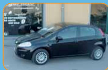
FIAT GRANDE PUNTO KM ZERO 12 CC - 5 PORTE - CLIMA - RADIO EURO 9.900 - PRONTA CONSEGNA