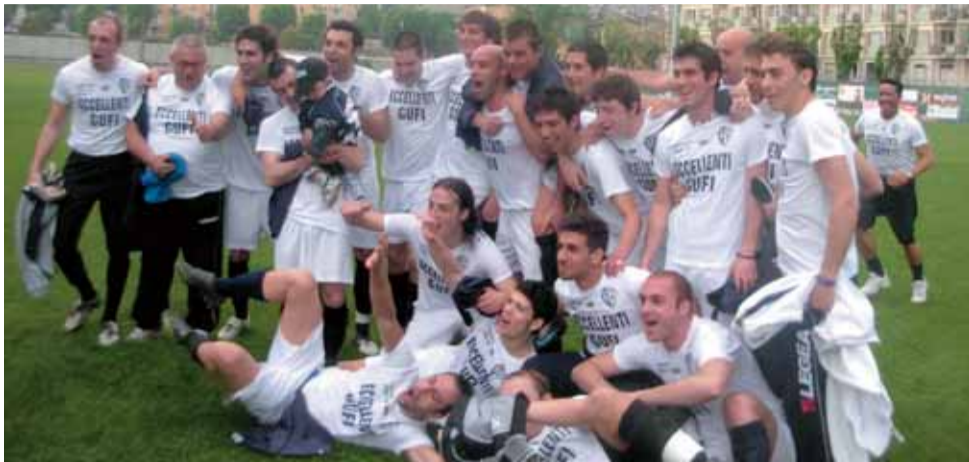
La festa al Barbieri nell'ultima di campionato.