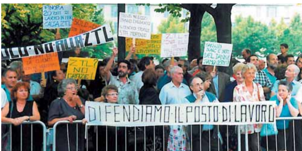
Nella foto di repertorio, la protesta contro la ZTL.