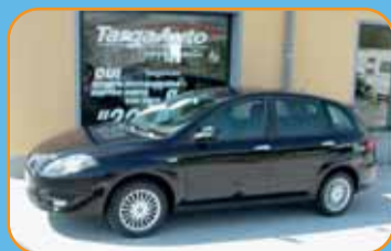
FIAT CROMA 1.9 MULTIJET KM ZERO - CLIMA - RADIO CD ABS - AIR BAG EURO 19.900

Vendita autovetture nuove di tutte le marche