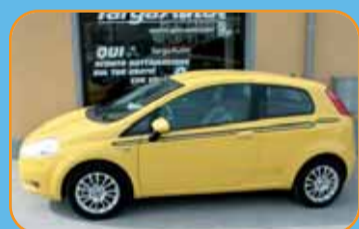
FIAT GRANDE PUNTO 1.4 TJET VETTURA SPORTIVA - KM ZERO EURO 13.500