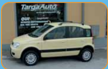
FIAT PANDA 4X4 1.3 MJET MOD. CLIMBLING