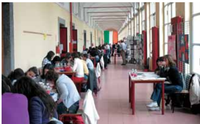
Giochi di matematica al porporato di Pinerolo, edizione 2010.

Dal 16 al 25 aprile si è svolta a Pinerolo la quarta edizione di Scienza in piazza, la manifestazione che unisce esperti dell'ambito e appassionati, per un viaggio alla scoperta delle discipline scientifiche. L'apertura ufficiale sabato 17 aprile, con le mostre "Rabdologia: la nascita della prima calcolatrice" e "La luce: illustrazioni e dimostrazioni" realizzate dal "Club della fisica" del Liceo Curie di Pinerolo, e "Lo sport nella scienza e nell'arte", presentata in occasione di "Ottobre Scienza 2009". Nell'ambito della manifestazione, lo stesso giorno il Liceo Porporato ha ospitato una ventina di squadre provenienti dalle classi di terza media e prima superiore del pinerolese, per i giochi matematici, organizzati dal gruppo della RetePin (Rete di scuole del pinerolese). In contemporanea la conferenza "Ragionamento sopra i massimi sistemi: vedere il mondo