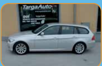
BMW 318 TD SW 140 CV VETTURA KM ZERO - FARI XENON CERCHI IN LEGA - EURO 35.500 NUOVO ARRIVO