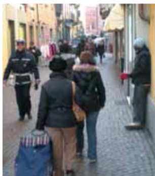
A lavoro nel centro storico.

Come ogni giorno di mercato a Pinerolo, nella città, giungono, con il treno, i "soliti mendicanti professionisti". Purtroppo, insieme a loro, giungono anche i borseggiatori, attirati dai portafogli degli ignari cittadini. Così anche sabato 1° maggio sono giunti in città per svolgere il proprio "lavoro". Grande la loro meraviglia quando, usciti dalla stazione, si sono resi conto che il mercato non c'era! Nel caso degli uomini di colore, che si piazzano nella città con il cappello