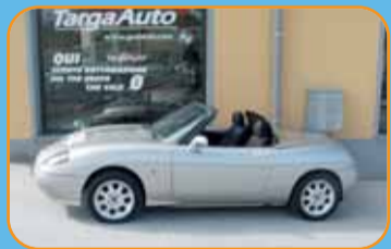
FIAT BARCHETTA 1.8 BENZINA UNICO PROPRIETARIO EURO 7.500