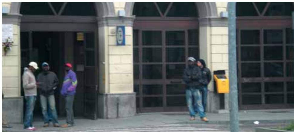
Fuori della stazione il 1° maggio in attesa del ritorno a Torino.