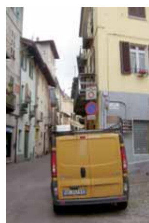
Uno scorcio di Via Trento.

"La riapertura penso che sia la soluzione migliore e più facilmente applicabile, anche perché soluzioni alternative, quali