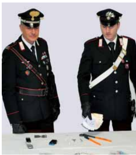
Gli oggetti da scasso per il furto e il denaro rubato.