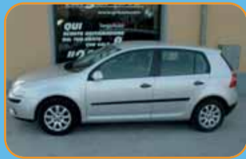
VOLKSWAGEN GOLF PLUS SPORT LINE - 2000 TDI - 140 CV EURO 13.900