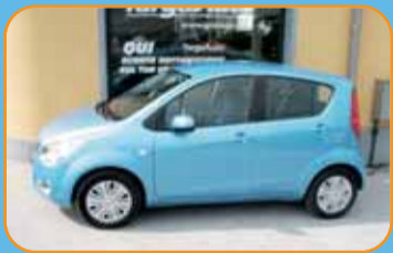
OPEL AGILA 1.2 2009 COME NUOVA - KM 2000 EURO 10.500 - NUOVO ARRIVO