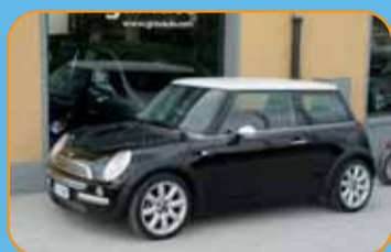
MINI COOPER 1.6 UNICO PROPRIETARIO - CLIMA CERCHI IN LEGA - RADIO EURO 10.900