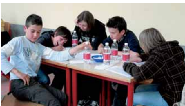
Una squadra al lavoro.

con gli occhi di Galileo". La manifestazione ha visto l'alternarsi di conferenze ed esperimenti dal vivo per ammirare, toccare, provare, costruire, presentati dagli studenti delle scuole coinvolte nell'iniziativa. Gli argomenti toccati: tecnologia, sport, astronomia e dibattiti filosofici sui massimi sistemi, nonché momenti di animazione e dibattito. Piazza Facta, Villa Prever, il Liceo Porporato e il Sumi sono stati il cuore della rassegna promossa dal Liceo scientifico