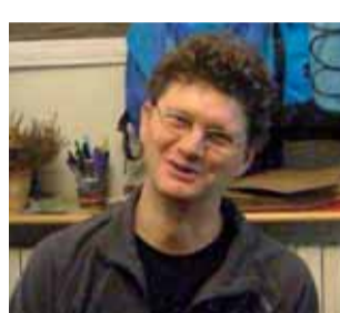
Coassolo di Aria Aperta.

co limitato. Nella via il 50 % delle persone che passano non ne hanno diritto e poi a che velocità vanno... Così com'è non ha alcun senso mantenere la ZTL".