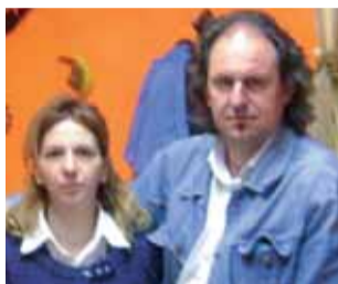
I titolari dello Scigno di Mary.

prensione. Un Sindaco pronto a risolvere i problemi. Vediamo come alcuni commercianti, ante e post ZTL di via Trento, giudicano questa scelta fatta 15 anni orsono.