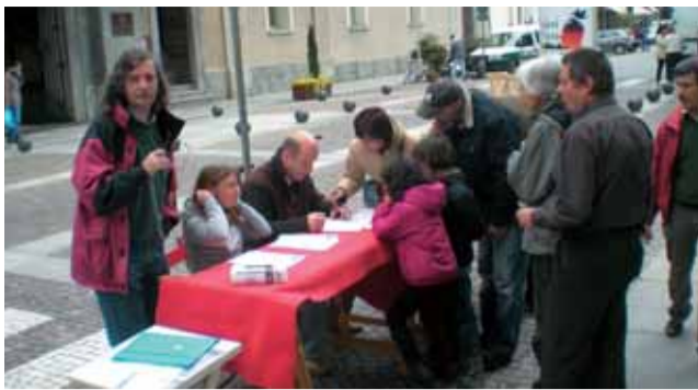
La raccolta di firme di fronte al Comune di Pinerolo.

Comitato per l'acqua pubblica Anche a Pinerolo e nel Pinerolese è iniziata la raccolta delle firme per i referendum per la ripubblicizzazione dell'acqua. I quesiti chiedono l'abrogazione di tutte le norme che hanno aperto le