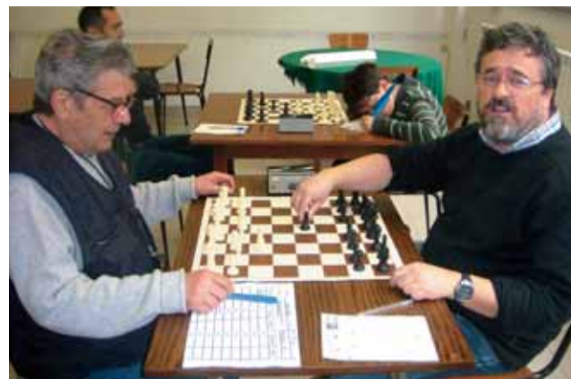
Fase iniziale del Campionato Sociale del Veloce.