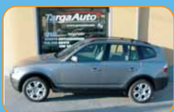
BMW X3 BENZINA KM 40.000 UNICO PROPRIETARIO NAVIGATORE - FARI XENON VERO AFFARE