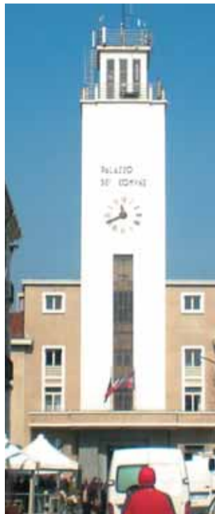
Il Palazzo Comunale.