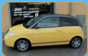
LANCIA YPSILON NUOVA CON ROTTAMAZIONE DI 3.600 EURO