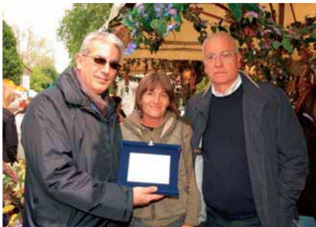
Sallen Piera premiata come miglior stand mercato europeo (foto di repertorio).

Gli espositori hanno dovuto fare i conti, come si è detto, nell'ultimo giorno di fiera, martedì 4 maggio, con un forte temporale abbinato a folate di