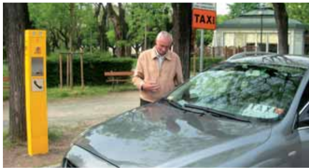
La nuova palina telefonica per i taxi in piazza Garibaldi (stazione ferroviaria).

Da alcuni giorni i pinerolesi hanno notato che sono state sostituite le ormai logore paline telefoniche per i taxi. Sono tre i nuovi servizi: due nella centralissima Corso Torino, l'altra in Piazza Garibaldi.