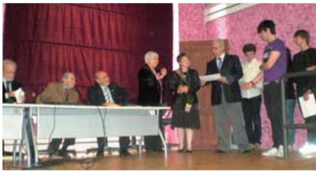
Presente anche la Preside del Liceo classico "Porporato", mentre vengono premiati gli studenti.