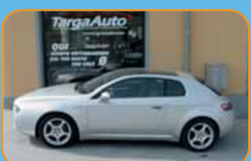
ALFA BRERA 2.200 JTS FULL OPTIONAL KM 23.000 CERTIFICATI EURO 19.900